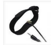
リファレンス電極バンド LP-IDREF01 ¥6,000(税別)